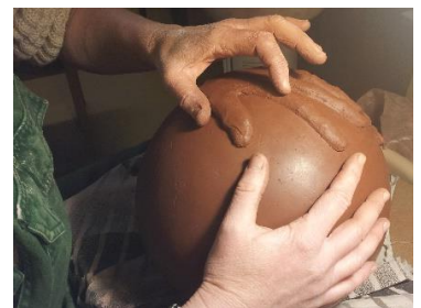
Urne, von Hand modelliert