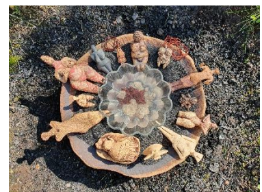
13 Urahninnen in meiner Feuerstelle

aus der Töpferei kommen wundersame Wesen zu Ihnen.