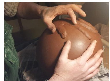
Urne, von Hand modelliert