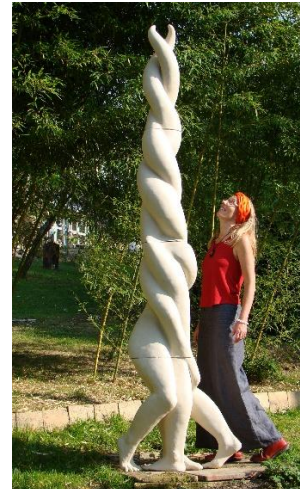
Bilder von weiteren Werken der Keramikerin